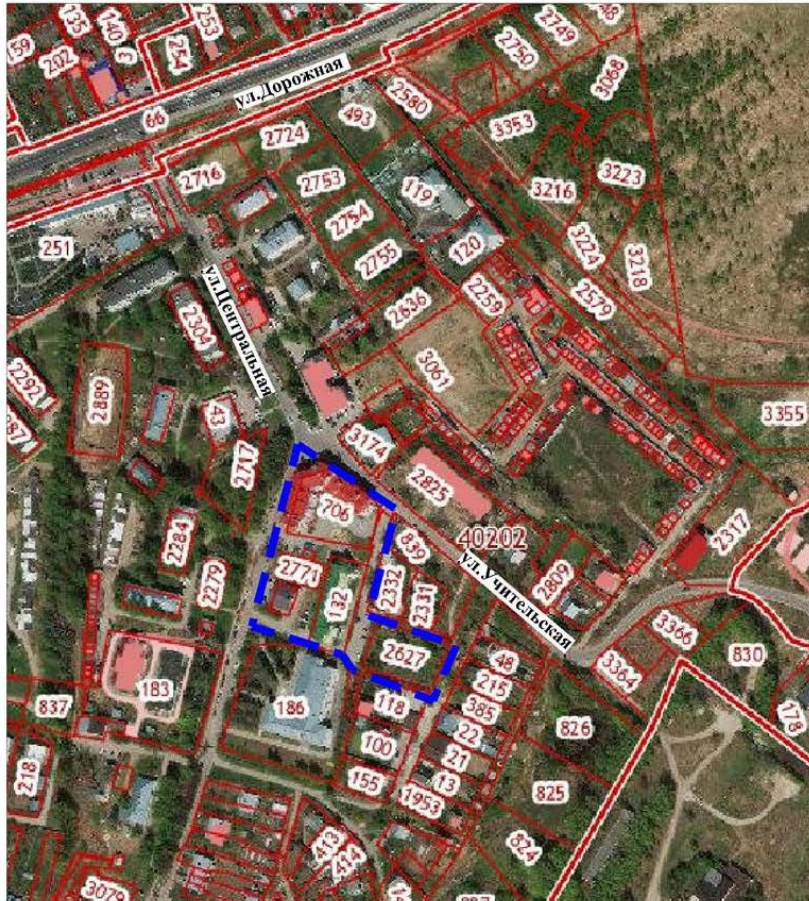
Схема границ подготовки документации по планировке территории